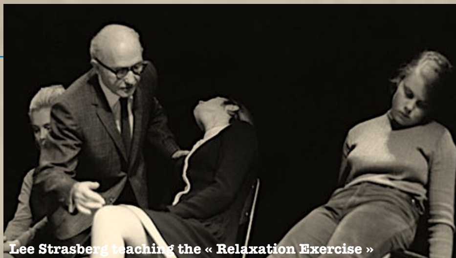
Lee Strasberg teaching the « Relaxation Exercise »

Pour s'assurer que les tensions physiques et mentales sont éliminées, chaque session débute avec le « Relaxation Exercise ». Dans la continuité de Konstantin Stanislavski , Lee Strasberg (qui y excellait) enseignait l'importance d'être détendu sur simple commande de sa volonté, afin d'entrer dans ce que K.Stanislavski nommait « l'Humeur Créatrice », là où tout bon jeu prend sa source. Cette humeur est décrite comme un état de conscience, mais aussi une capacité de savoir où et comment, les sens et les émotions peuvent fonctionner et s'exprimer pleinement. Lee Strasberg répétait souvent que les acteurs « ont besoin d'un coeur chaud et d'une tête froide » pour gagner le contrôle sur leur corps et leur esprit et se libérer d'obstacles envahissants tels que Tension, Conditionnement, Absence de Concentration, etc.