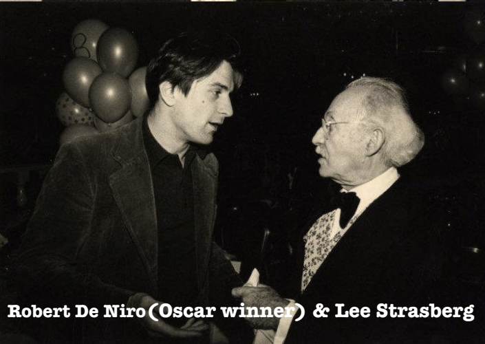
Robert De Niro (Oscar winner) & Lee Strasberg