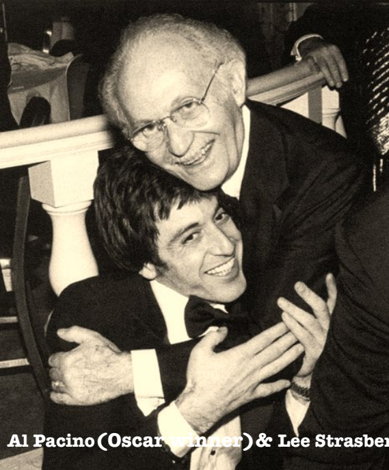
Al Pacino (Oscar winner) & Lee Strasberg