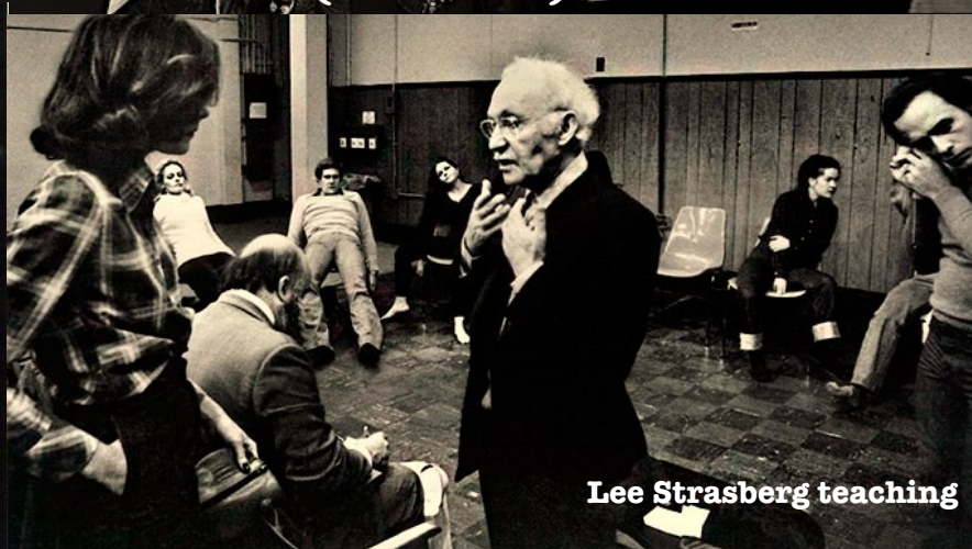
Lee Strasberg teaching